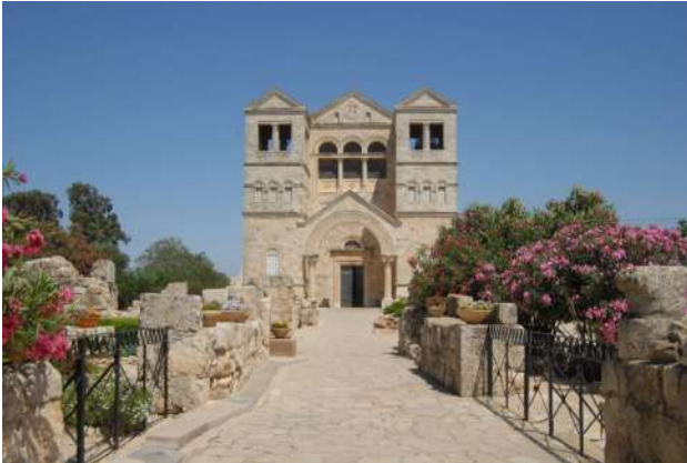
Basilica della trasfigurazione – Monte Tabor – Israele

Ad un certo punto della sua storia Dio gli chiede di sacrificare il figlio suo, il figlio che realizza tutte le promesse fatte, il figlio della promessa di Dio. Abramo è posto davanti ad una scelta drammatica: o conservare il figlio delle promesse di Dio, mantenere in vita il figlio che realizza le promesse di Dio, o fidarsi ancora di Dio, affidarsi alla nuova parola di Dio che gli dice di sacrificare proprio questo suo figlio.