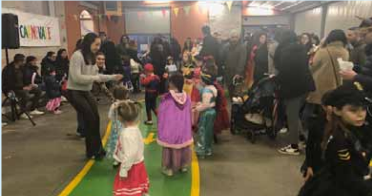
Carnevale, 14 febbraio 2026.