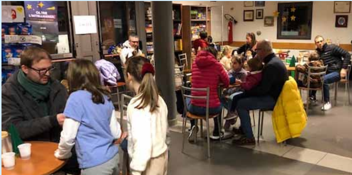
Cinema in famiglia, 18 gennaio 2026.