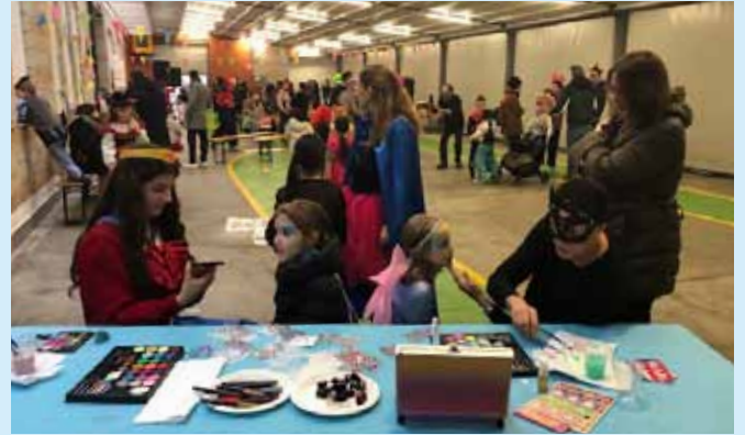
Carnevale, 14 febbraio 2026.