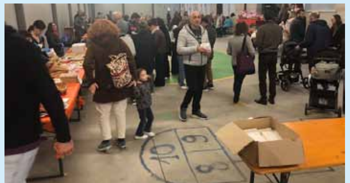
Castagnata, 9 novembre 2025.