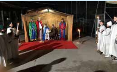
Festa della luce, 4 gennaio 2026.