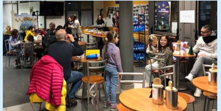
Cinema in famiglia, 18 gennaio 2026.