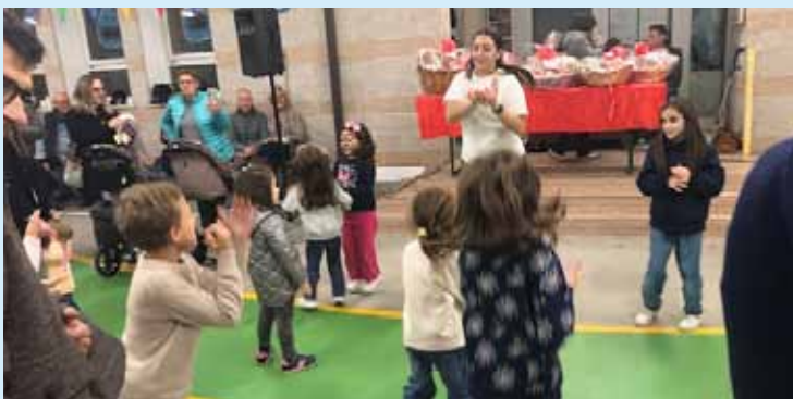
Castagnata, 9 novembre 2025.